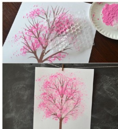
Du papier bulle