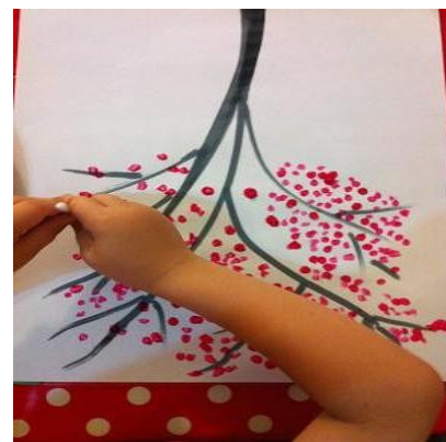
Un coton tige